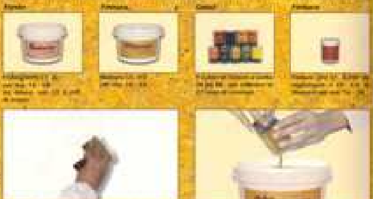
Colorare METEORE con il TINTORE