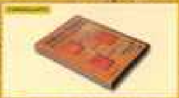
Colorare METEORE con il TINTORE