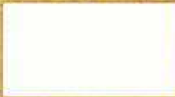
Colorare METEORE con il TINTORE