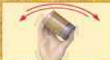
Aggiungere il TINTORE