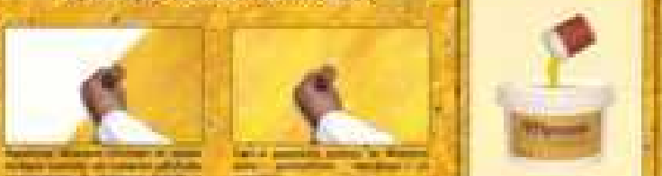
Colorare METEORE con il TINTORE

È possibile aggiungere a METEORE già colorato, la FINITURA ORO e procedere, per una rappresentazione decorativa ad ottenere l'effetto Classico Antico oppure Venato Marmoreo con riflessi dorati.