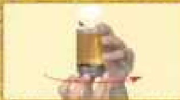
Colorare METEORE con il TINTORE