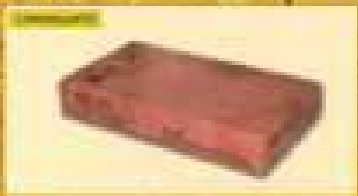
Colorare METEORE con il TINTORE

Ad esempio per il colore 500 A aggiungere 80 ML di TINTORE, per il colore 500 B aggiungere 20 ML di TINTORE, eccetera per il colore 500 C aggiungere 4 ML di TINTORE. Volendo ottenere altre sfumature di colore è possibile utilizzare più quantità mescolate o miscelare il TINTORE.