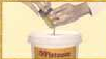
Colorare METEORE con il TINTORE