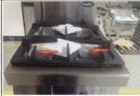
1.2 LINEA 700 CUCINE SENZA FORNO