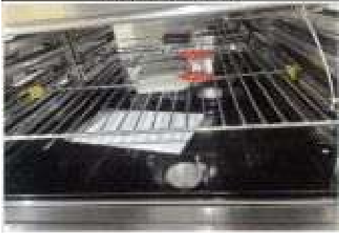
1.1 CUCINE CON FORNO