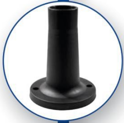
BASE DA TERRA